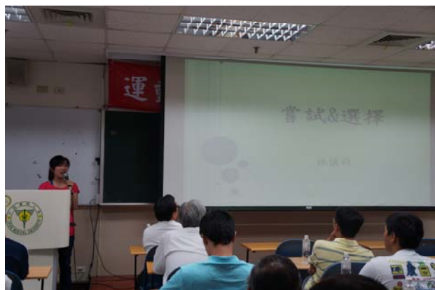
圖四 林 O 昀系友-嘗試&選擇