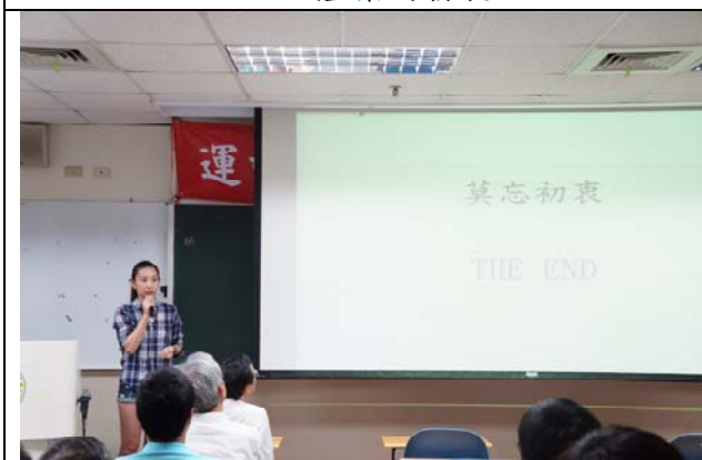
圖五 Q&A 時間