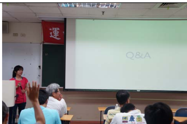
圖六 Q&A 時間