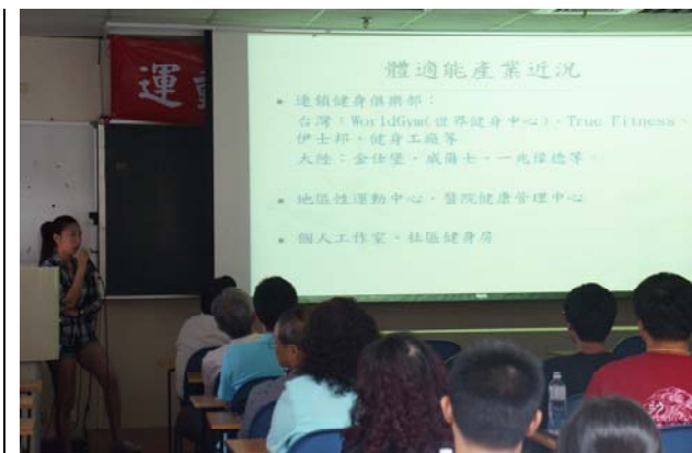
圖三賴 O 茹系友-運動醫學系未來在體適能產業的發展